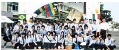
平成25年 卒業アルバムより