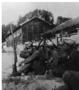
昭和16年 卒業アルバムより

100年を迎え、廿日市高校のさらなる発展の礎となるよう、記念事業に対し、皆様方の温かいご理解とご協力をお願い申し上げます。